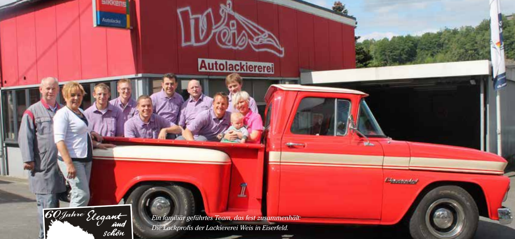
Ein familiär geführtes Team, das fest zusammenhält: Die Lackprofis der Lackiererei Weis in Eisenerfeld.